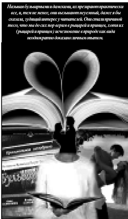
Называя бульварными и дамскими, их презирают практически все, и, тем не менее, они вызывают неуемный, даже я бы сказала, зудящий интерес у читателей. Они стали причиной того, что мы до сих пор верим в рыцарей и принцев, хотя их (рыцарей и принцев) исчезновение в природе как вида неоднократно доказано личным опытом.

Вывод. Не стоит ждть, когда тебя спасут, ибо это может произойти не скоро. Выход есть всегда, и он состоит не в том, чтобы найти МСМ (Мужчину Своей Мечты), который придет на выручку в нужный момент, а в том, чтобы не ждть его и действовать. В общем, на Бога надейся, а сам... В итоге вы не пожалеете. Просто не забывайте, что не каждый мужчина, который спасает вас, - Mr. Big.