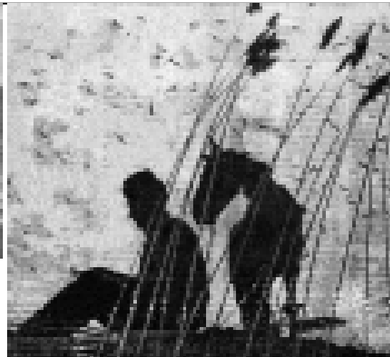
Къыргызстанда аты айтылган поэт, кѳйчу - Къудайланы Маштай.