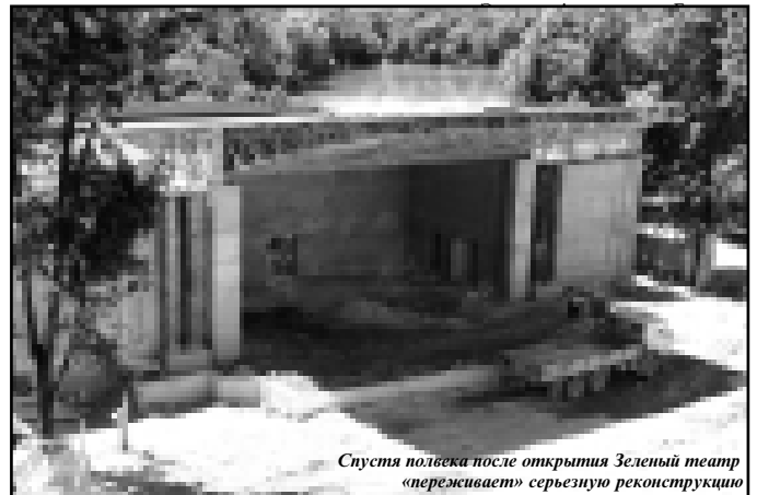
Спустя полвека после открытия Зеленый театр «переживает» серьезную реконструкцию