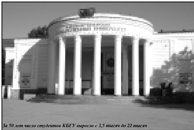
За 50 лет число студентов КБГУ выросло с 3,5 тысяч до 22 тысяч

Что только не знала его сцена за полвека своего существования! Здесь свою зна-