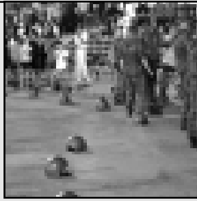
оставили лежать свои каски на асфальте.

В итоге злопыхатели нальчан так и не дождались столь ожидаемого ими камнепада со стороны болельщиков «Динамо», которых в Нальчик приехало около 50 человек. Обстановка у гостевого сектора была настолько спокойной, что даже военнослужащие внутренних войск, привлеченные для охраны общественного порядка,