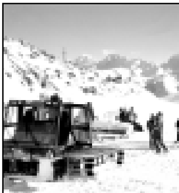
Минга тауну тийресеңде, лъкъ трасаны жазырау.