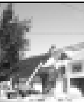
Культура юйю кѣромдосо.

процентге тамалангандыла, бусагъатда уа ичинде, тышында да къабыргъаларына шпаклѣвка этиле турады, залга гипсокартон урулады, саханы полу къагъа бла, ашлаучна плиткала бла тышлангандыла.