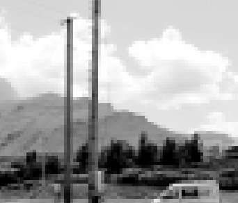
Энди элдерибизде мобильный телефон байламлык шендден ити боуруга учуйды. Аны алайгыгына Биллини алыи кыйырына ишене турган антенна шагьталык этеди. Аны монтажн Кисловоденен келген сызьялык тамамлайдыла. Сурат МАМАЯЛЛАНЫ Алийинди.