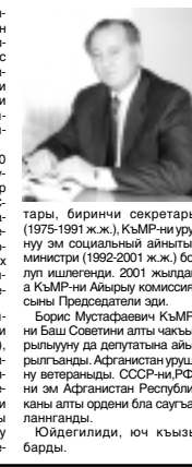
Тюнеон КъМР-ни Парламентини жыйылында жашарын кыой кёпюруу бла Зумакуланы Мустафаны Жашы Борис Къабарты-Малкъар Республикада Адамны эркинликлери жаны бла улпономочейннн къуллугуна бирча ыразылыкка беш жылгъа салынганды.

рыбызда Бахсан, Элбрус, Чегем, Прохладна, Терк районланы, Нальчик эм Бахсан шахарланы маллары турадыла. Жолгъа атлангандан алгъа алгъа тийишли ветеринар профилактика этиленди, керекли документте тийишли хата жарашдырылгандыла. Кысыксы, кёчюу бла байламлы ишле бир торлю къошмаузуз этгендиле дегер болду. Фермала бла къошла тау болмулагъа июсонорондо бошамгандыла. Малла сютлери ала, Сёз ючюн, хар ийнекден момент орта эсеп бла кёп калмай, 14 килограмм сют сауудыла. Кысыр тууарла, кыойла, ала да семирде бардыла. Ол затлагы жайлыкылада отланды илг болганды, малчыла алгъа чыкылганды жууула лагъа жууалы къарагъанлары ахшы себеплик эдиле. Ахыры 2-чи беттеди.