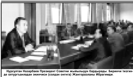
Нурсултан Назарбаев Президент Советни жыйынуулары барысында. Биринчи тизгинде олтурған адамдар экинчисин (солдан оңга) Жангоруланы Ибрагимди.