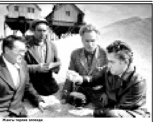
Жангы тирлик элекпеди.

лар ючюн, бар мадарлары этгенде. 1997 жылы март айында айтылган производствонун мурдорунда кооператив кыргызалды, кыргыздан битеу производствого ючюлени, журтланы, малланы, кой кызылталына озып агызылды. Ижевскиени алгын аман ишленгенде деп бир киши да айталык тойюлдо. Болсада, битеу молк коллективни кызуна тошкенден сора уа, ана болгонди ити урунды деп айталыкчыбы. Бир кооператив кыргызалганы жалон жый озган эсе да, производствого ючюери кеп кыямый жангырылганда, эки керге кейбейтилгенди. Аны хайырындан миллион жыллык обороту 1 млн доллар 632 миллион тенге болады (5 тенге бир сомну туталды). 60 торло аш-азыкь про-