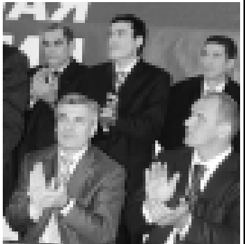
Алчылык ючюн тугуууу.