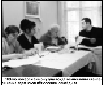
103-чю номерли айырыу участкада комиссияны членлери неча адам къол кетюренин санадыла.