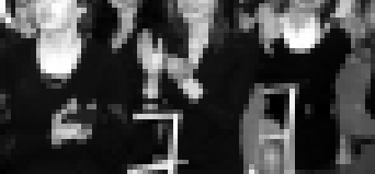
Суртлар КВАРЕИ Элиня трихаш