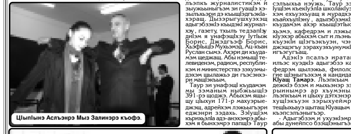
Цыпына Асхээр Мыз Запирер Кыфо