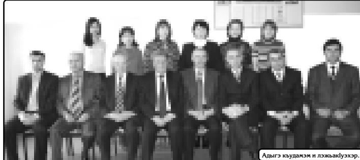
Адыг кудамд и лэжкюдыр