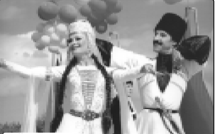
Махуэшхуэ ислъэм. Суртлър МАМИЙ Руслан трыгъш.