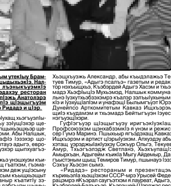
Хьэртэ Хуэуэ Эзэгьзэщэ