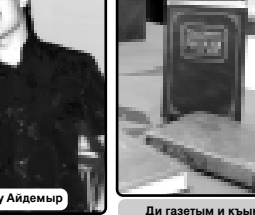
Хьэртэ Хуэуэ Эзэгьзэщэ