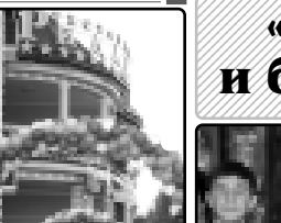
«Фыкьэблагэ, хьэшэ лэпэлэхэ»