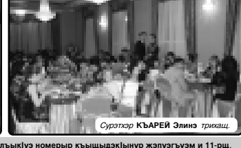
Хьэртэ Хуэуэ Эзэгьзэщэ