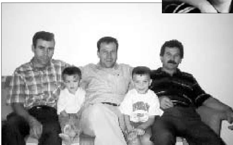
С братьями и племянниками

«Их можно назвать вполне симпатичными, если забыть о том, что они являются вражескими аскерами (то есть солдатами)».