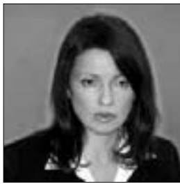
Юлия Григян (в замужестве Тимошенко)

Юлия Владимировна вскоре стала руководителем промышленно-финансовой корпорации «Единые энергетические системы Украины» с оборотом в 11 миллиардов долларов США. Этот момент можно считать началом восхождения Тимошенко к вершинам власти. Пользуясь поддержкой лидера партии «Громада» и премьер-министра Украины Павла Лазаренко, эта корпорация вскоре приобрела монополию на торговлю российским природным газом на Украине. Это произошло в 1995 году, когда Украина стала «самостийной и незалежной». На посту президента ЕЗСУ Тимошенко находилась до 1997 года, то есть до отставки покровителя, а затем, оставив свой