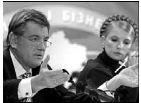
С Президентом Украины Виктором Ющенко

ищем ныне живущего деятеля? Нет». Характеризуя итоги оранжевой революции, другой бывший соратник Тимошенко, член фракции «Наша Украина» и вице-президент ПАСЕ Сергей Головатый сказал: «Неуемный, экстремистский авантюризм Тимошенко победил патологическую нерешительность Ющенко». Последним и, наверное, самым главным штрихом, завершающим портрет Юлии Владимировны Тимошенко, были слова оплеванного и преданного ею нынешнего номинального президента Украины Виктора Ющенко: «Многие действия, в которых участвовала премьер-министр, осуществлялись