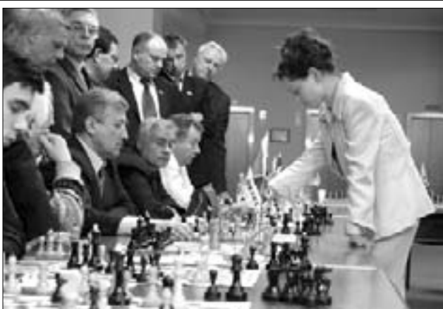
Александра Костенюк проводит сеанс одновременной игры в Государственной Думе. 19 марта 2003 г.