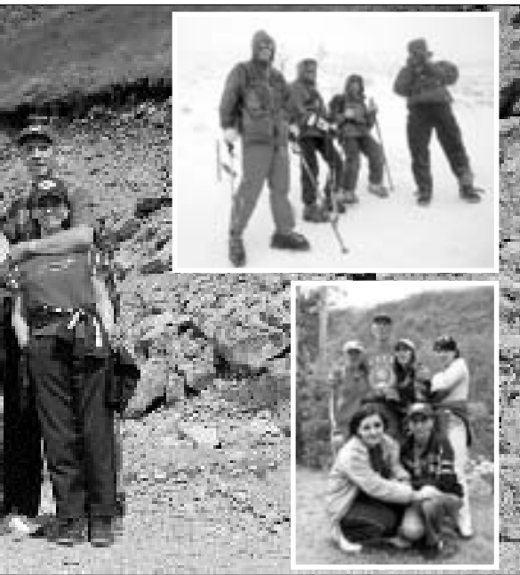
Восхождение на Эльбрус оставило незабываемые впечатления

Короче говоря, девиз нашей акции «Дарующий хорошую книгу дарит целый мир!» был воспринят нашими читателями как призыв к активному действию. Порадовало то, что, как и год назад, никто не использовал акцию как предлог избавиться от завала литературы: как содержание, так и состояние книг было очень хорошим. Другим предлогом для радости стало и то, что количество собранных книг намного превысило прошлогоднее: в акции-2007 их было пятьсот с лишним, в акции-2008 мы немного не дотянули до тысячи!