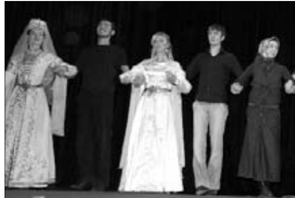
Танец дружбы на презентации