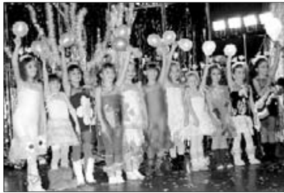
Акция «Мир в ладошке» стала настоящим праздником

Когда обращение с призывом о сдаче книг ставили в номер в самый первый раз, не скроем, были сомнения в том, что оно найдет достаточно широкий отклик. Сомнения эти долго не продлились: такого количества звонков и визитов не ожидал никто. В акции приняли участие взрослые и дети, пенсионеры и школьники, мальчуганы и жители других населенных пунктов, причем многие даже отказывались представляться, считая, что ничего особенного не делают. Нам пришлось книжки поштучно и десятками, самые свежие и старые издания, мы ездили забирать ящики и коробки с литературой в будни, праздники и выходные. Не поверите, но даже сейчас, спустя несколько месяцев, до сих пор находятся желающие отдать свои книги для участия в акции. Но, увы, придется подождать или по примеру некоторых читателей, к которым мы не смогли добраться по независящим от нас причинам, самим отвезти свою литературу в другие нуждающиеся библиотеки