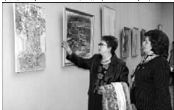
Выставка художниц Кабардино-Балкарии прошла с успехом

«Петушок не только привлекает внимание своей красотой и ярким оперением, он и сам преклоняется перед всем