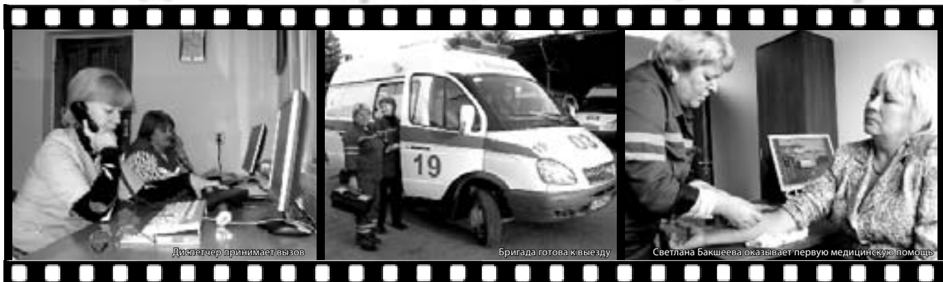
Диспетчер принимает вызов