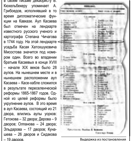
Выдержка из постановления о переименовании селений

После установления Советской власти постановлением ревкома Нальчикского округа от 8 июля 1920 года «по многочисленным просьбам трудящихся» и в целях забвения «проклятого прошлого» 43 селения, носивших имена прошлых владельцев, было переименовано. Не избежал этой участи и аул князей Касаевых. Теперь он стал именоваться селением Ших-Исмаиловское. По поводу этимологии этого названия никаких документов найти пока не удалось. По мнению автора, оно происходило от имени какого-нибудь известного в этом селении богомольца, которых в Кабарде именовали словом «шихъ», то есть шейх. Под этим названием Ших-Исмаиловское просуществовало до 1924 года. С этого периода оно стало называться в свете новой кампании по борьбе с религией Баксаненком, так как «большой» Баксан в то время стал одним из крупных населенных пунктов автономной области.