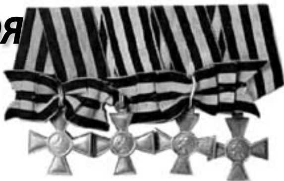
Георгиевские кресты четырех степеней

В 1913 году статус ордена поменялся вновь, в основном в него включили дополнительные статьи и расширили описание военных подвигов по родам войск. «Знак отличия военного ордена», называемый «солдатским Георгием», приобрел официальное название Георгиевского креста. Срок выслуги для производства в следующий чин кавалерам 4-й степени был сокращен до минимума – от одного года в младших офицерских чинах до четырех лет в генерал-майоров в генерал-лейтенанты. Были существенно расширены льготы для георгиевских кавалеров. Теперь