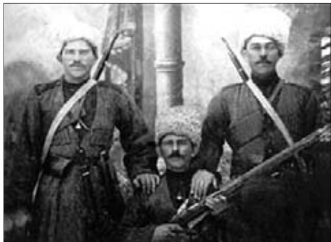
Всадники Дикой дивизии