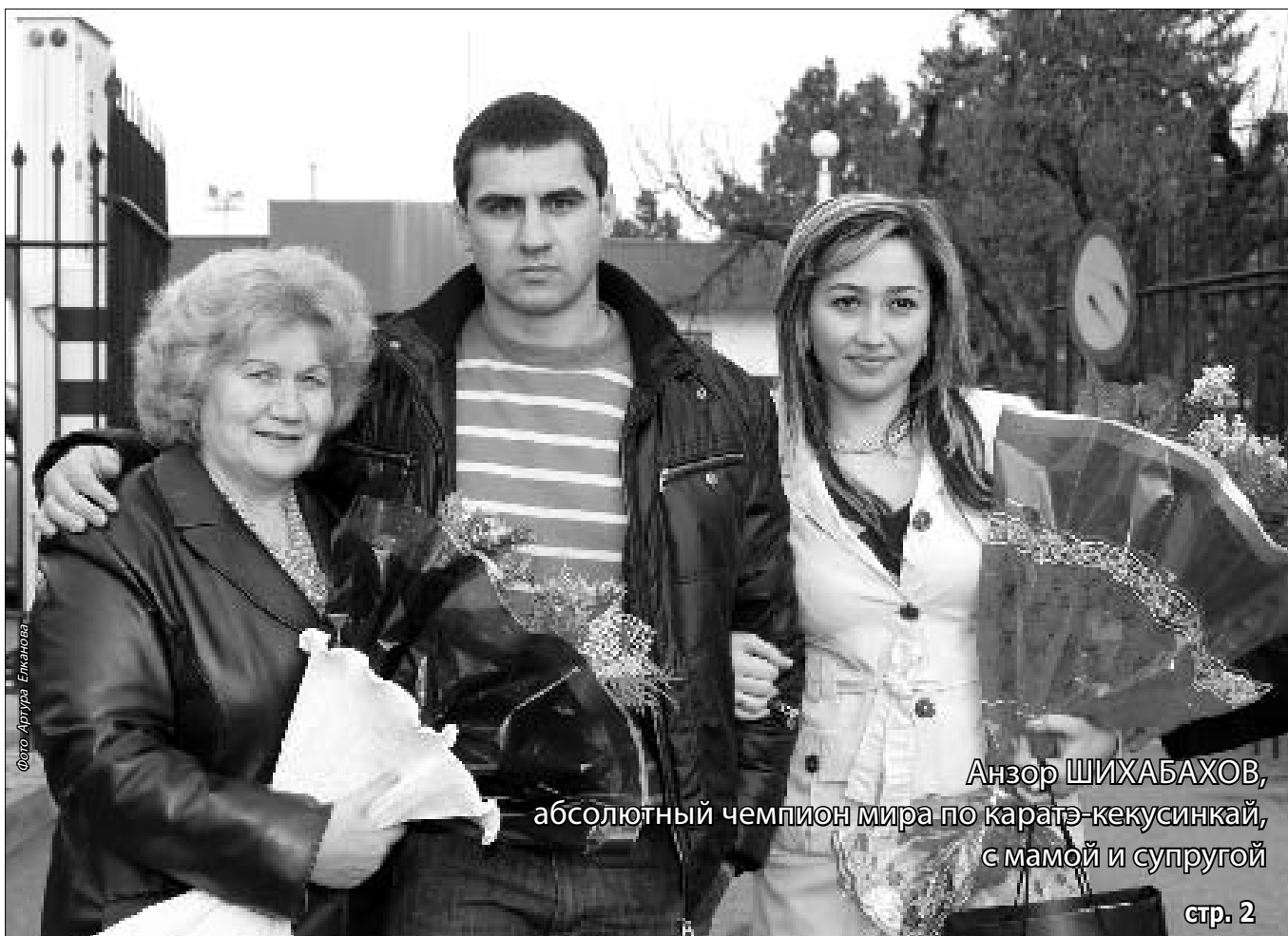
Анзор ШИХАБАХОВ, абсолютный чемпион мира по каратэ-кекусинкай, с мамой и супругой