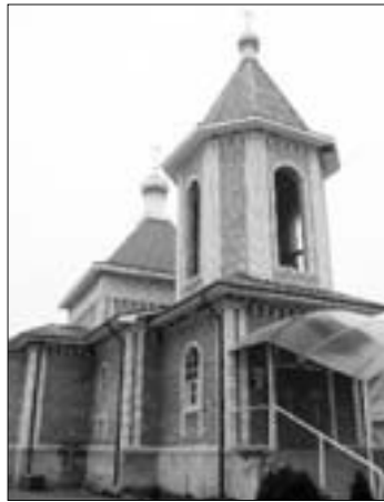
Православный храм в станице

Я очень люблю свою станицу, каждый человек мне дорог. Удивительные люди живут здесь. Когда отец Сергей задумал строительство церкви в лихие 90-е, никто не верил в успешное завершение его замысла. А ведь смог объединить верующих для благого дела, построили храм. Более того, он организовал детский приют «Отрада» при храме. Там живут дети, которые имеют крайне отрицательный опыт жизни. Они не приживаются в интернатах, но отец Сергей находит с ними общий язык. Наш храм в православные праздники посещают верующие из многих уголков России. Мне приятно, что люди приезжают к нам молиться. Так что в станице добрые порывы есть, а там, где порывы, обязательно забрежит свет в конце тоннеля.