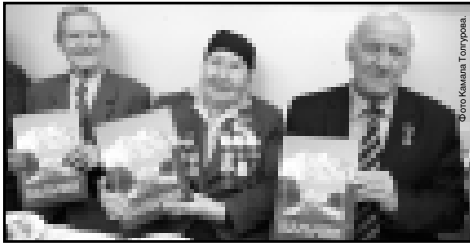
Альпийская гонимая, которая производит неогромные впечатления. Организаторы не забыли и о кино-видеоматериалах. Короткая документальная лента - смонтированная хроникальный коллаж из советских и немецких документальных фильмов, - стал одним из самых знаковых экспонатов выставки. И демонстрация ее в Национальном музее, безусловно, наиболее впечатляющая в истории Великой Отечественной, одной из самых захватывающих страниц которой, в контексте битвы за Кавказ, явилась сражения за освобождение Кабардино-Балкарии и Нальчика. И если суммировать увиденное нами в Национальном музее, то хочется сказать: «Шла война. История пишется».

Трудно оставаться равнодушным, когда видишь столицу республики, превращенную фашистами в руины. Но Нальчик, не взирая на трудности, выстоял и победил. И 65 лет, прошедшие с тех пор, стали годами созидания. Свидельством тому - и современная облик Нальчика, запечатленный на фото-