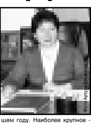
Окончание. Начало на 1-й с.

на себя. Это повышает и требовательность к качеству плодовоовощной продукции, которую могут предложить аграрии. - Раньше неплохой спрос у населения имел продукция Нальчикской макаронной фабрики, но на прилавках ее давно нет, в то время как продукция крупных производителей сильно подорожала. Конечно, остановка Нальчикской макаронной фабрики, которая была вызвана необходимостью модернизации производства, расширения ассортимента и выпуска конкурентоспособной продукции, отразилась на темпах роста производства макаронных изделий - 33 процента к уровню 2006 года. С марта прошлого года на предприятии реализуется крупный проект по организации производства короткорезанных макаронных изделий на общую сумму 115 млн. рублей за счет привлечения кредитных ресурсов. Построено новое здание производственного цеха площадью 2,0 тыс. м 2 , приобретено современное оборудование. Производительность линии по выпуску короткорезанных макарон достигла 20 тонн в час, общий объем производства после выхода на проектную мощность составит 8 тыс. тонн.