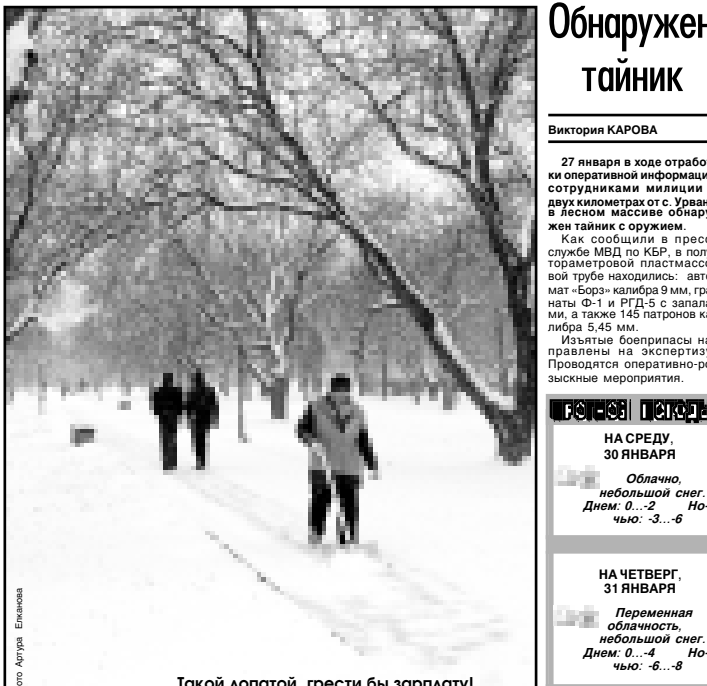
Такой олопотой грести бы зарплату!