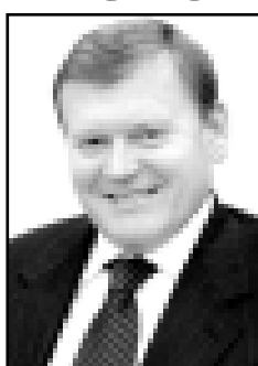
Труда и полных кавалеров ордена Трудовой Славы

«Проект закона «О внесении изменений в отдельные законодательные акты РФ в целях повышения размеров отдельных видов социальных выплат и стоимости набора социальных услуг» предусматривает повышение размеров ежемесячных денежных выплат гражданам, имеющим право на меры социальной поддержки...»