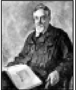
Фотография сделана в Гаграх 27 октября 1948 года, за день до смерти С. Анисимова

Интерес к Кавказу пробудился у Анисимова еще в студенческие годы, воплотившись в первую книгу «Вечный снег и лед».