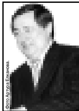
На съезде присутствовали 119 руководителей вузов.

До этого Ассоциацию вузов России возглавлял Виктор Савиных - президент Московского государственного университета геодезии и картографии, а Барсоби Карамурзов являлся членом Совета Ассоциации.