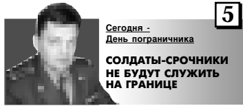
Сегодня - День пограничника

СОЛДАТЫ-СРОЧНИКИ НЕ БУДУТ СЛУЖИТЬ НА ГРАНИЦЕ