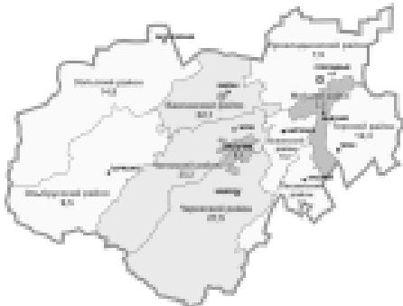
Диаграмма № 6

Уровень регистрируемой безработицы (в % к экономически активному населению)