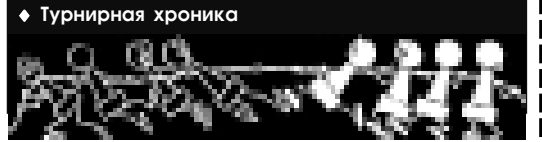
◆ Турнирная хроника

Определен состав сборной России на Всемирную шахматную олимпиаду, которая пройдет с 12 по 25 ноября в Дрездене. В команде сыграют Владимир Крамник, Александр Морозевич, Петр Свидлер, Александр Гришук и Дмитрий Яковенко. Отметим, что шахматная олимпиада начнется спустя всего 10 дней после окончания матча за мировую шахматную корону, в котором Крамник постарается отобрать титул у действующего чемпиона мира – индийца Вишванатана Ананда.