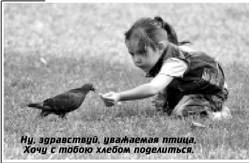
Ну, здравствуй, уважаемая птица. Хочу с тобой хлеб поделиться.

отношения с друзьями или родственниками. Будьте осмотрительны - часто скандалы возникают из-за невнимательности.