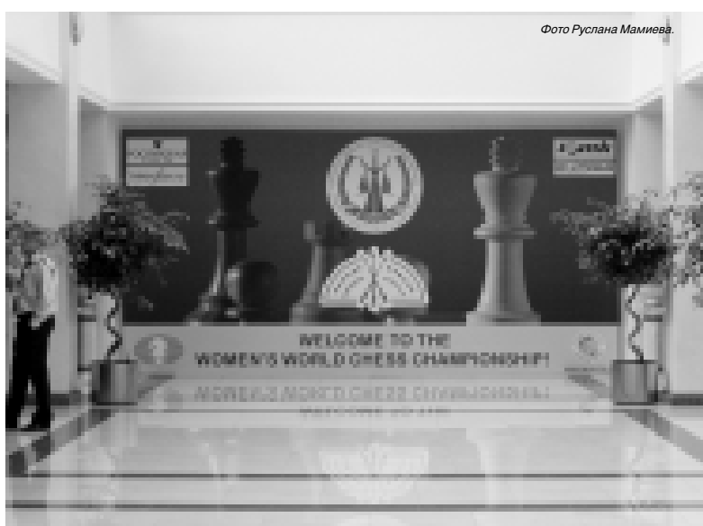
Интер-отель «Синдика» - резиденция чемпионата мира по шахматам.