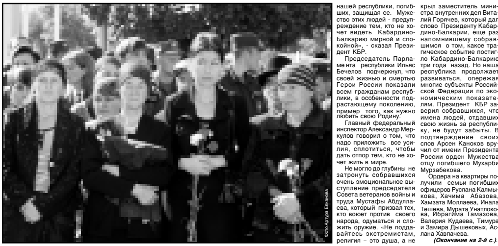
(Окончание на 2-й с.)

После торжественного вноса в зал знамени МВД по КБР мероприятие от-