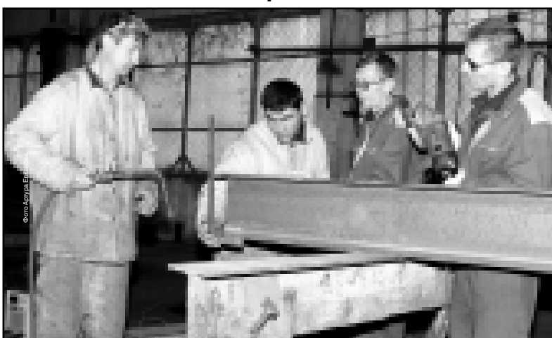
Для производителей металлоконструкций поставщик «семь раз отмерь, один раз отрежь» - актуальна всегда.

(Окончание. Начало на 1-й с.) Персонал предприятия вместе с ИТП составляет 99 человек. Завод постепенно набирает обороты. В связи с чем строят перспективные планы. Мы намерены открыть второй цех, перейти на двухсменную работу, а значит, будет расширен штат, увеличено количество производимой продукции до 500 тонн в месяц. Предмет строительства административно-бытового корпуса, столовой.