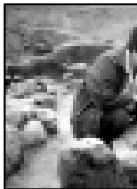
Все-таки кое-что доверили и корреспонденту «КБП».

дывает рядом. Наметанным глазом она сразу определяет, что это прекрасно сохранившееся женское захоронение. Логика и знакомые из соответствующей литературы описания аналогичных находок подсказывают: расположенные по обеим сторонам два маленьких ящика – детские погребения, останки которых в отличие от взрослых не сохраняются вообще.