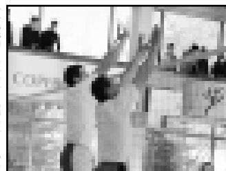
Материалы рубрики подготовлены спортивным обозревателем «КБП» Альбертом ДЫШЕКОВЫМ.

Восьмой розыгрыш Кубка Президента КБР по волейболу, проходивший в спортуале КБГУ, собрал 16 команд из городов и сел республик.