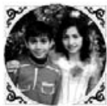
Милана къарындашчыгъы бла

Мен уллу болсам, юрист усталыккъгъа окъурукъма, алай назмула жазгъанымы уа къоярыкъ туююлме. Бек суюеме, Къулийланы Къайсынча миллетими атын айтдырыгъа.