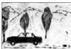
«Мешина бужю кётюрюп кетди. Мешинада уа Кыайырбек эди».