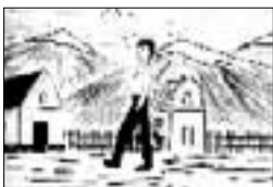
«... Ууакъ ташиланы ары-бери ура, Мазан орамда айлана эди».