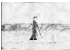
«Мазан чалгъы чала турады».