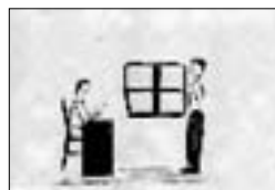
«Мазан Асхатны сорууларына жауап эте турады».