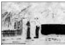
«Мазан экзаменден эки алгъанын атасына айта турады».