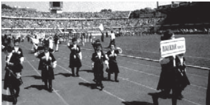
Мухтар юйретген сабийле Стамбулда «Бешикташ» деген стадионда

Хар замандача, бу жолгъу фестивальгъа да бек азындан беш жюз адам къатышханды. Мухтар да хар жылдан (онбир жылны ичинде) ары 40 сабий элтеди. Фестивальны сайлауу уллу болгъаны себебли Мухтаргъа да бек кёп ишлерге тюшеди сабийле бла – фестивальдан бет жарыкълы болуп кьайтыр ючюн. Стамбулда «Бешикташ» деген аты дуниягъа белгили стадионда фестивальны Азербайджандан келген кьонакъла ачарыкълдыла