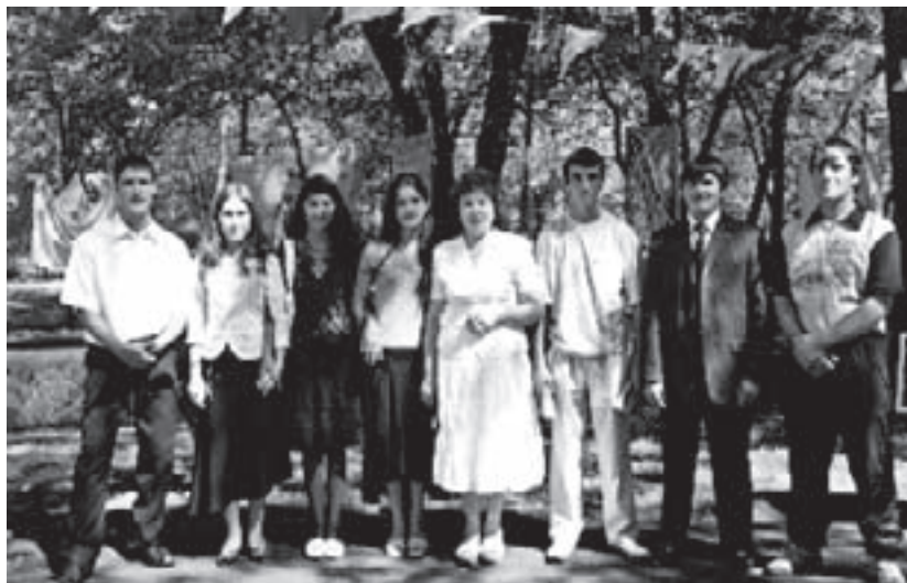
Галина сохталары бла (2007 жыл)

орамда, къайда да юйрене кёреме деп келген эди. Ушагъыбызда аны сагъынама да, ол а былай айтды: