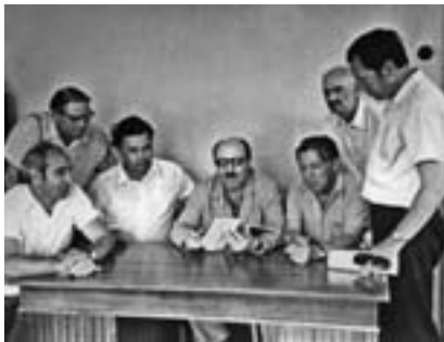
Балькэр усакуэ цэрылуэ Кулиев Къайсын «луащхэмахуэ» журналым и редакцэм я хьэщлэщ

Апуэдэу щыт пэтми, альманахым и зэфлэкыр, и къэухыр къэзэвэккыу щидзаш цыхум я зэхэщылккыу пэтми зызыужкыым. Нэрылыагы хуаш лъэпккыым и гыщлэр лъэныкыуэ куэдккэ ди нэгу кыщлэзыгыэххэн журнал дилэн зэрыхуейр. Зэуэ къемыхуллами, ди лъэпккыр мыгувэу лъэлэсащ а и хуэпсаплэм: «луащхэмахуэ» зыфлащэ журналыр 1958 гъэм и февраль мазэм япэу дунейм кыитехуауэ, ильэс 50 мэхъури зэи зэпыу имылауэ мазитл къэсккэ зэ кыдоки. Дунейм кыитехыаккэщ номер 300, мыр абы кыпыуэвэ кыйдэкыгыуэщи, мин бжыгыэ кыккэлпыккыуэну Тхьэм жил!