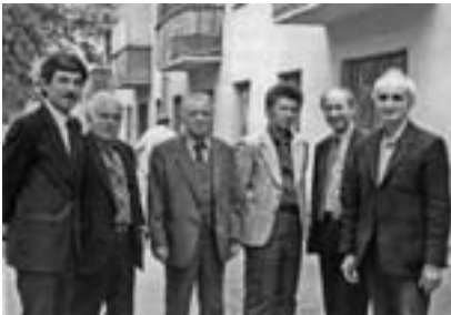
«Луэщхэмахуэ» журналым щылажээхэмрэ адыгэ тхаклуэхэмрэ.

Редакцэм и тхыдэм кыыхэнапхыэщ ар кыыщызылуаха махуэм щидзэу ильэс 40-м щигыуккэ машинисткэу абы щылэжыа Пхьэ-вакьащлэ Марзидан. И хьэдрыхэ дахэ Тхьэм ищлэ, цыыху Иэдэбу, емызшыж лэжыаклуэу кыытхэтащ ар зы унагыуэ курых хуэдиз