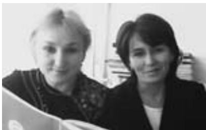
А еджапIэ дьдэм и еггэджакIуэху «Туащхэмахуэ» журналым фIыкIэ хуэхуапсэхэм ящыц Уэрыш Iэминатрэ Чэртбий Луизэрэ.