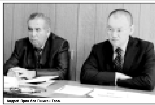
Андрей Ярни бла Пшикан Таов.

Халкъдан ача алып этилген битеулю жумушланы ёлчемденде автотранспорт бла жууш этюу 18 процентни тутды. Автомобиль эм шахар электротранспорт бла быйлыны биринчи жарымда 29 миллион адам журиюлгенди, быйлыны бу кезюнден эсе 7,5 процентге кеп. «Бахсаньенко», «Терекатов-сервис», «Майское», «Нарткалинское», «Зольское» автотранспорт предпринятилада, троллейбус управлендилада пассажирлени журиуу жаны бла керюмдоло азыгъанды. Коммерция халда жукъ ташуу бла корешген предпринятила эм предпринимательле эки миллион тонадан аслам жукъ ташыгъанды, ол а быйлары бу кезюу бла тенгелдиргенде 15 процентге кепди. Министерство пассажирлени журиууно кесирине эм