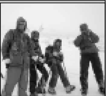
«Аргументы и факты» газетден.