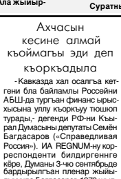
Ахыры 2-чи бетдеди.