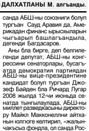
Ахыры 2-чи бетдеди.