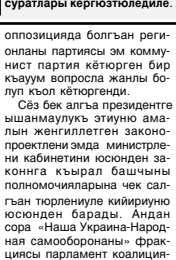
Ахыры 2-чи бетдеди.