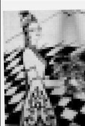
Ахыры 2-чи бетдеди.