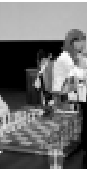
Ахыры 2-чи бетдеди.