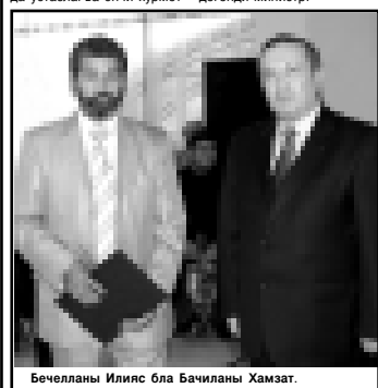
Бечелланы Илияс бла Бачиланы Хамзат.

Къууанчлы жыйылыну ача туруп, КъМР-ни билим беруу эм илму министри Сафарбий Шхагапов битеу къыраллада да, халкълада да устазлага энчи хурмет этилгенни чертгенди. «Хар адам устазлары эм жууукъ адамлары бла тег кереди. Устазла сабийлени жамууат-да жашарга юйретелени», - дегенди министр.