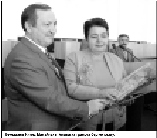
Бечелланы Илияс Мамайланлы Аминатха грамота берген кезиу.

но атыгъыз Къабарты-Малкъарны тарыхына алтын харфла бла жазылганды, - дегенди ол. - Быйыл биз энита да бир байрамны белгилейбиз: Парламентини 15-жыл-