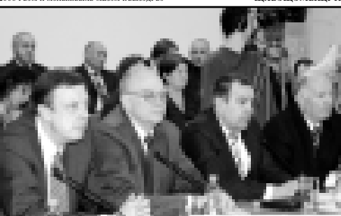
Суртгар МАМИЙ Руслан трихэц.

ИСТЕПАН Залинэ. Суртгар КЪАРЕЙ Элиэ трихэц.