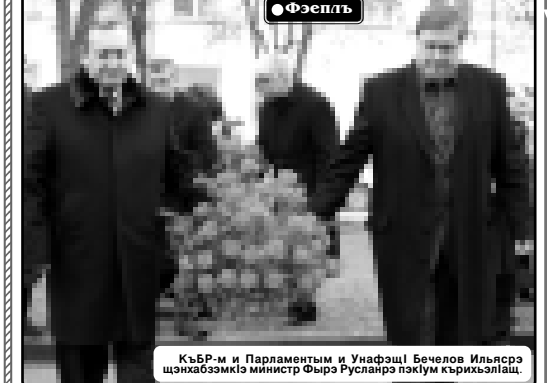
КЪБР-м и Парламентым и Унафэци Бечелов Ильясрэ...