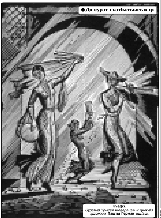
Кьафа. Суратэр Урсей Федерациям и цыкхуах художник Папты Герман ишцэц.