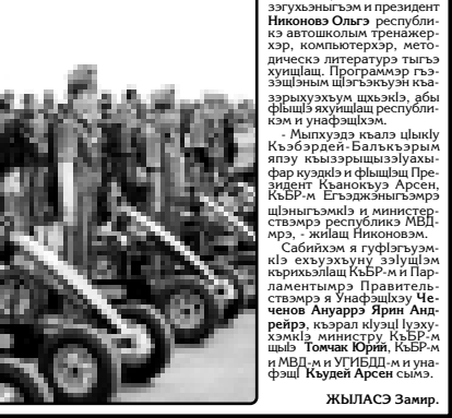
Жылгэуэ лэжыгъэхэм сом мелуан 26,2-рэ хуах

«Синаика» интэр-эццэтынмкI шынагууэахэм и есхэуэахэм гургууэр зыхатI, Дуэныг и шахматистI нахьыфIхэм иышцI зы КамскинI Гата абы есхэуэахэм и есхэуэахэм цыгуагууэахэм зылгэуэахэм.