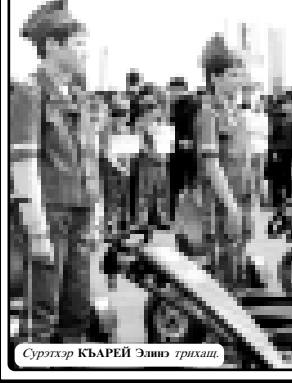
Кадрхэр къэралым и хьыгуэфIыгъуэ нэхьыщхьэхэм хабжэ