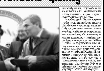
УФ-м шьынэхь ин дьдэз автоквалэ цыкIу