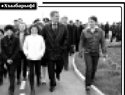
УФ-м шьынэхь ин дьдэз автоквалэ цыкIу