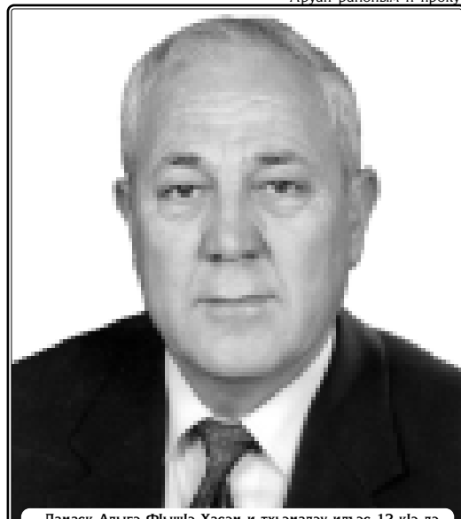
Дамаск Адыгэ Фыльчэ Хасэм и тхьэмэдэу илэс 12-клэ лэ-жъа, Сирие Хьэрып Республикэм и Парламентым и Комитет-ым и Унафэщлэ шхьта Абазэ (Маршэн) Шэрэф лъэкъ лухуэм куэд шлауэ хуэлажэ.

Редактор нэхъышхьэхэр: ХьФЫШЦЦЭ Мухъэмэд ДЕРБЭ Тимур ТХБГЪЭПЭСЭУУВАЖКЛУЭ