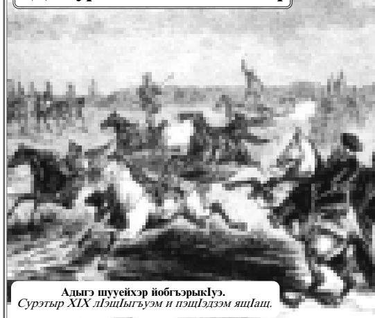
Адыгэ шуейхэр йобгьэрыдгь. Сурэтэр XIX лэшыгьгьэм и пэшгьдэм яшаш.