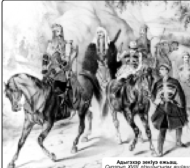
Адыгэхэр зекIуэ ежъаш. Сурэтэри XVIII лIэщIыгъуэм ящIаш.