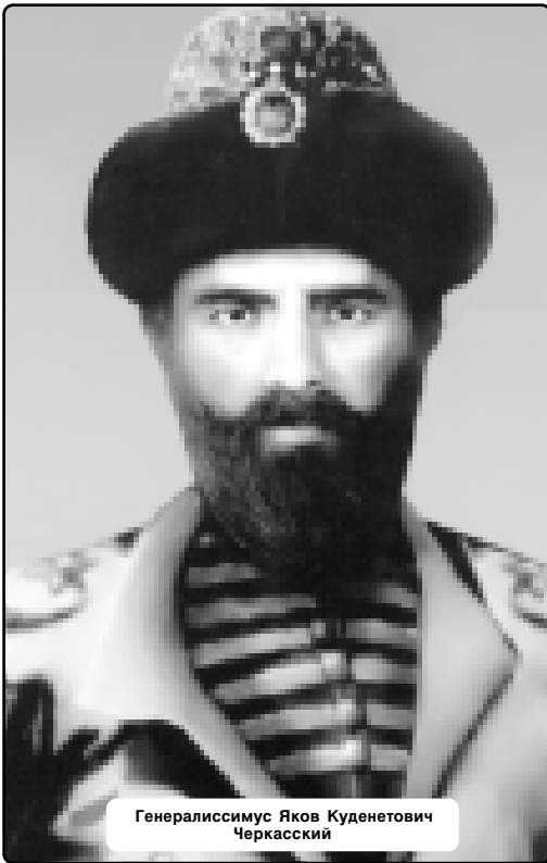
Генералиссимус Яков Куденетович Черкасский

Впрочем, есть и другое мнение, впервые высказанное русским генералом графом Ал. Игнатьевым: Рюрик приехал один, без всяких братьев. Ведь по-шведски сине-хус означает свой дом, а трувор - верная дружина. То есть Рюрик приехал не с братьями, а со своим домом и с верной дружиной. Если царь Иван Васильевич Рюрикович, то царица Мария Темрюковна - Рюриковна. Не ее ли подразумевал поэт Александр Блок в своих стихах: