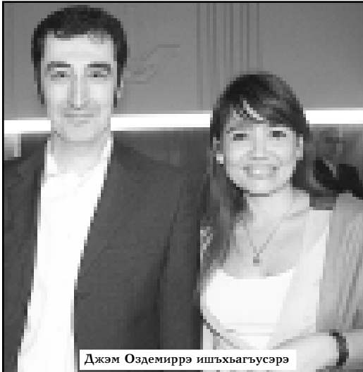
Джем Оздемиррэ ишхьагьусэрэ

Уджыху Ихьсан адыгэ льэпкьыр кьэушумэзгьэным зэрэфьэкІэу пыл. Анахь-ыбьэ тильпэпкьыгүхэр зыщыпсээрэ нэмькІа кьалэхэм Адыгэ Хасэхэр ащы-зэ-хэщгьэнхэм, ахэм Иоф зыщашІшт унэхэр зэтэг-гэпсыхьагьэнхэм, ныб-