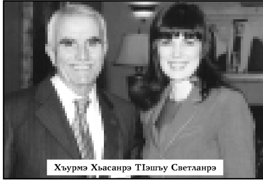
Хьурмэ Хьасанрэ Пэшэу Светланрэ

2007-рэ ильэс. Апэрэу IэКыб хэгъэгүм сэ-кIогагъэ. СыздакIо-гъагъэр Хьэшимит пачыхьэм икьэралыгъоу Иорданиер ары. СиIоф зыпфэцта? Къэбар гэшлэгъоныхэр кьэсыгуоинхэ слъэкIышцта? Тезыгъблэгъагъэ тильэккыгъухэм ащыIаIэ сьд фэдэ? Гьогум сьтетыфэ упчIабэ шхьэкIуцIым щызэблэкIыгъэ. Тхьамафэу Иорданием ащыгъом кьыщызгэкIогагъэм зэкIэ сызгъэгумэкIыгэр упчIэхэм ядзэуап щызэгъыгъагъэ.