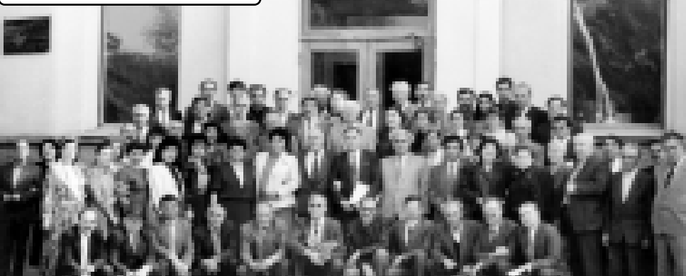
Дунейм шиккъыа адыгэхэм ятехуа зэлүщлэхуэ Черкесск къалэм шокълэуэклэ. Абы кърихьэллэщ Сирием, Иорданияем, Тьркум, США-м къыккэ хьэщлэхэр. Къэбэрдей-Балъкъэрым, Адыгейм, Къышр-м, Москва, Саратов цыщ шлэныгъэхэр. 1991 гъэ, жэпуэгъуэм и 18