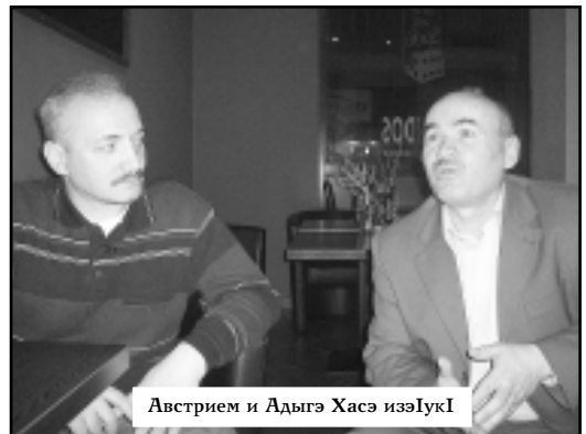
Австрием и Адыгэ Хасэ изьІукІ

Депутатэу Джем Оздемир дэсшыгыгэ зэдэгүшчыІэгүм кьызырщыкыгьэщыгьэмкІа, зэрэадыгэм лэшэу рэгүшхо. «Тильпэпкь дахэ, хабзэу хэлыыр дунаим шагьэшІагьо. Ар чІэгынэ хьуштып. Сэ Адыгьем сьунагьо сьигьусэу сьыкьэкІоггагь. Сипшашьэ адыгэ шьуашэ ащ кьышчы-гьэдыгьагь. Саер щыгьэу Адыгэ зэфэсхэм тахлэжьэу кьыкьэкІы», - кьысІоггагь ащ.