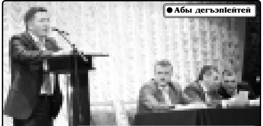
Лыдыкэ Хэбэдулэслам кыпсалэ, шыкэр Куушырэкыуэ...