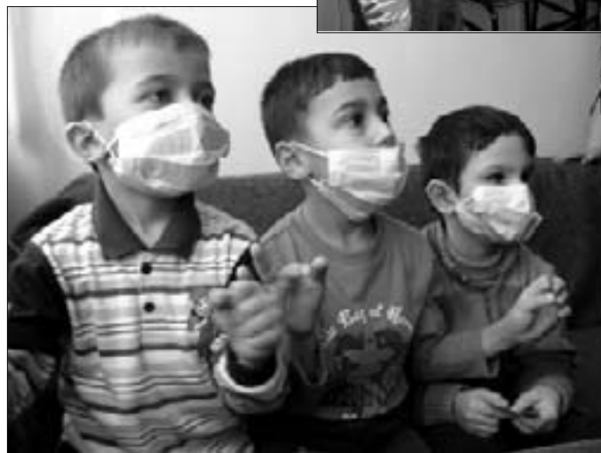
Детям было очень интересно