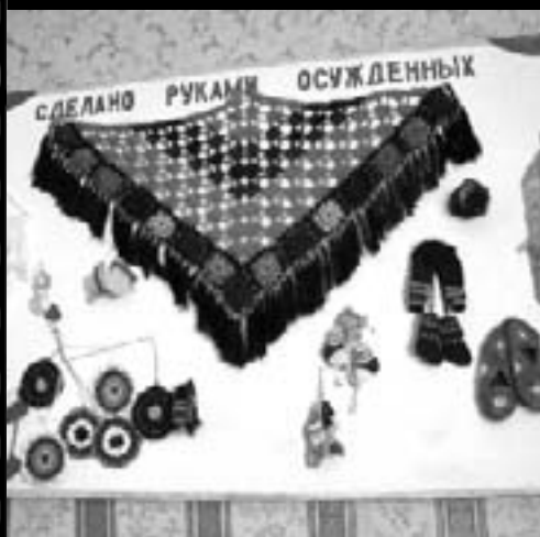
...в комнате отдыха

● Материалы разворота подготовила Марзият БАЙСИЕВА.