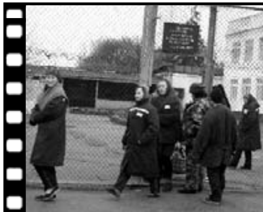
Во дворе колонии...

...аза. Осуждена ... ...тиков. Как мно- ...т от круга об- ...ми» людьми. И ...ро заработать ...ля – легкие, но ...расивой жизни. ...жда, поездки – ...попалась. Дали ...ва месяца. ...ть от жизни не- ...о немало: кра- ...единственный ...приезжают ко ...и оправдаться? ...а их вижу. Они ...еще бы, стыдно ...Единственное, ...и, к родителям, ...огать им. Потя- ...расивой жизни? ...ось.