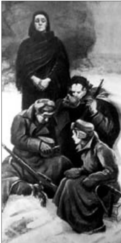
Мать солдатская, 1969-1976 гг.