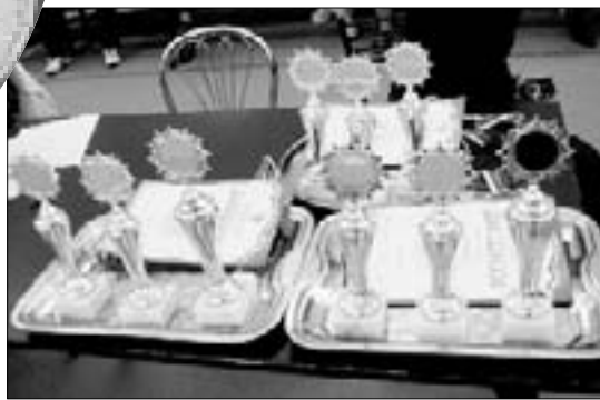
Кубки для победителей

Самой сильной и в прямом, и в переносном смысле этого слова