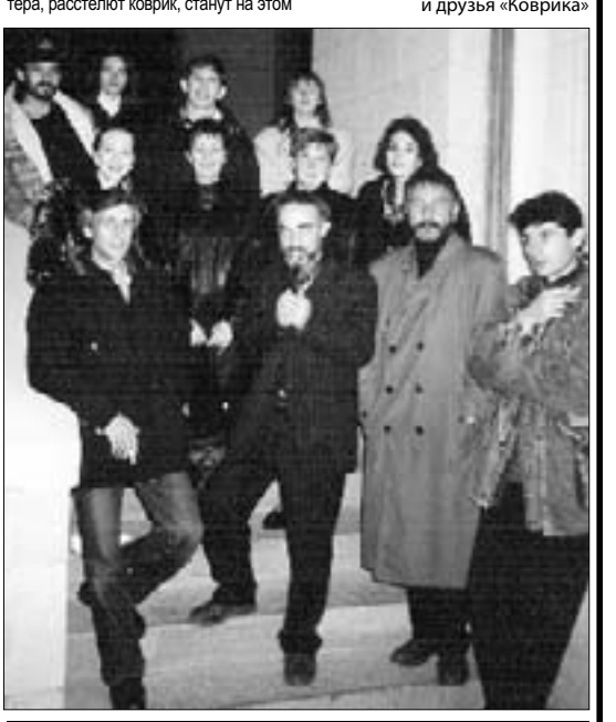
Театр «Коврик» на фестивале в Ставрополе (1995 г., октябрь)

коврике играть - и будет ТЕАТР»... Браво, «Коврик!» Спасибо, Казбек!.. ● Благодарные зрители и друзья «Коврика»